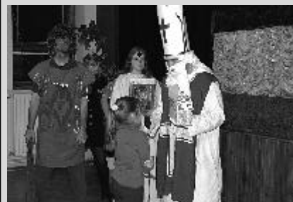
Mikulášská nadílka v DDM Kamarád

Pořádání těchto akcí k nimž patří dětské karnevaly, diskotéky, besedy se zajímavými hosty, pořádání výstav, Mikulášská nadílka,