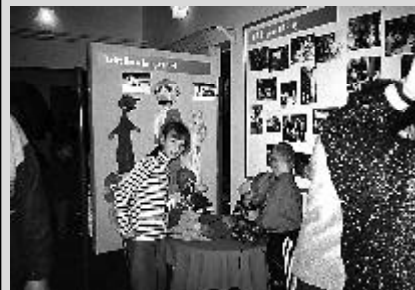
Výstava loutek v DDM Kamarád

To patří samozřejmě i našemu zřizovateli, městu Třemošná, podílejícím se především finančně na spoustě našich akcí. Těší nás jeho zájem a velmi dobrá spolupráce.