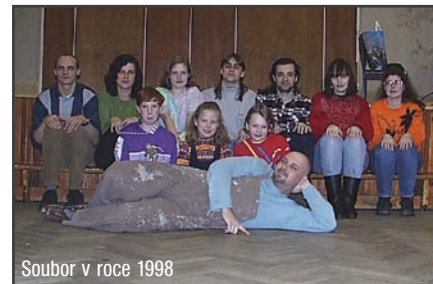
Soubor v roce 1998