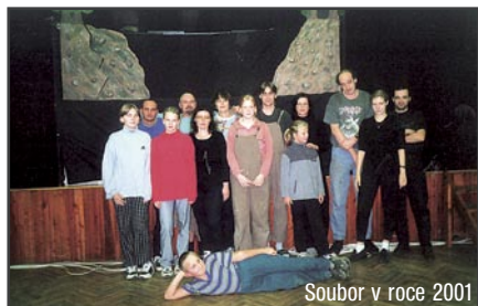
Soubor v roce 2001

V listopadu 2001 soubor oslavil svoje osmdesátiny ve velkolepém stylu. Během narozeninové soboty sehrál celkem 5 pohádek, které shlédlo přes 400 diváků. Hráli jsme Krakonoše, Kouzelnou galoši, Jak Honza vyzrál na princeznu, Vodníkovu Haničku a večer premiérově zatím naši nejsložitější pohádku - Hrátý s čertem.