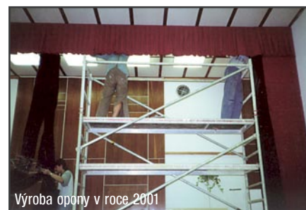
Výroba opony v roce 2001

V roce 2001 nám město Třemošná poskytlo finance na zvelebení sálu v DDM. Soubor tak ušil i vyrobil svépomocí oponu a výkryty na sále v DDM Kamarád.