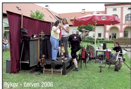
Býkov - červen 2006

Podívali jsme se tak pro zajímavost poprvé na Dny lidí dobré vůle na moravském Velehradě, do Jindřichovic pod Smrkem, Stříbra, Prahy, Strakonice, Hořovic, Petrovic, Holýšova, Železné Rudy, Kaznějova, Horní Břizy, ale také na hrad Velhartice, zámek v Horšovském Týně, a do kláštera v Kladrubech a Mariánské Týnici, hráli jsme v plzeňském nákupním centru, na bolevecké návsi a nebo na býkovském statku.