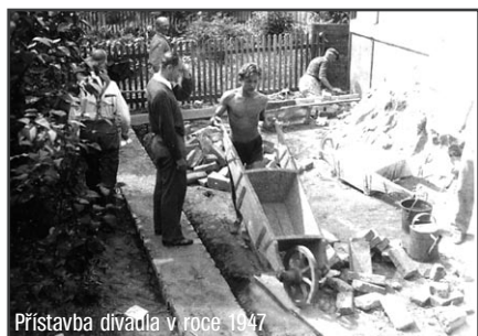
Přístavba divadla v roce 1947

Ze zbytků kovové konstrukce se vyrobilo ještě zájezdové jeviště, takže třemošenské loutkové divadlo poznaly děti, ale i dospělí v okolních obcích. V roce 1953 přešla loutková scéna do majetku Závodního klubu Západočeských keramických závodů. I když ZK ZKZ zakoupil divadlu tovární sériové loutky - marionety, s nimiž hrajeme dodnes, nastalo období stagnace.