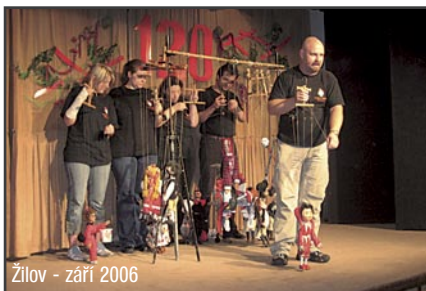
Žilov - září 2006

Nyní totiž neustále ke každé zkoušce a představení je nutné oba dva divadelní skládky vystěhovat a zájezdovou konstrukci postavit na sále, což zabere 2 hodiny před představením a zkouškou a 2 hodiny po jejich skončení. Mohli bychom tak tento čas věnovat tvůrčí práci.