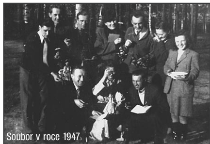
Soubor v roce 1947

Kultura brzy po válce začala opět žít. Lidé se sice vyměnili, odstěhovali, přistěhovali, ale nadšenci se našlo dost. A tak se 25. prosince 1946 - před 60 lety - konalo první poválečné loutkové představení v Třemošné, kterým byla Schweigstillova hra Krejčík, švec a Kašpárek. Hrál se s 25 centimetrovými loutkami.