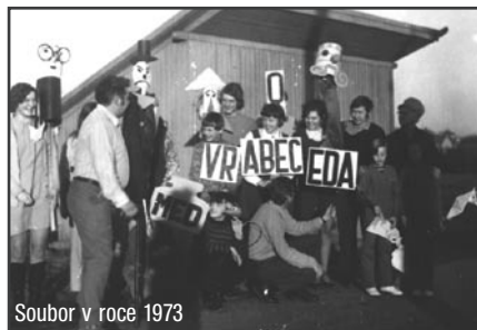
Soubor v roce 1973

Soubor tedy začal hrát nejen marionetová, ale i maňásková představení. Přichází do souboru čerstvá mladá krev - žáci ZŠ. Začalo období značné zájezdové činnosti divadla, jenž své představení předvedlo ve všech větších obcích okresu Plzeň - sever.