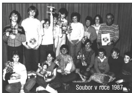
Soubor v roce 1987