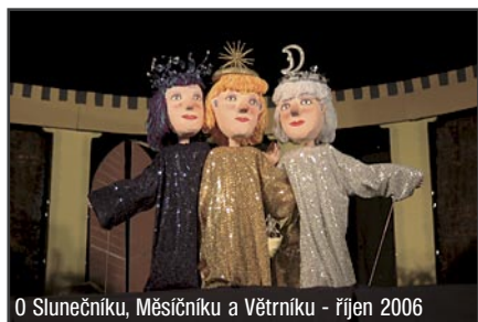
O Slunečníku, Měsíčníku a Větrníku - říjen 2006

Průměrně nyní sehrájeme celkem během sezóny cca 40 pohádkových představení, z toho ve Třemošné 10. Od roku 2001 jsme připravili pro naše malé diváky celkem 8 premiérových představení - Hrátý s čertem, Honzu u krále, Kašpárka v pekle, Ptáka Ohniváka a lišku Ryšku, Zlatovlásku, O statečné princezně Máně, Aladinovu kouzelnou lampu a nyní chystanou O Slunečníku, Měsíčníku a Větrníku.